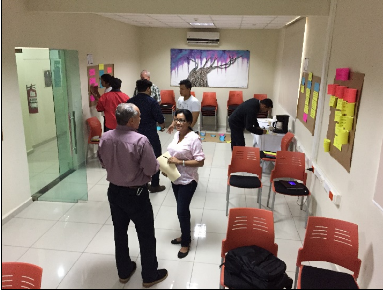
II Jornada de planificación en investigación: preparación de matrices con perfiles de proyectos (junio, 2017).

Visibilidad e impacto de la UC: Participación en aproximadamente 15 actividades convocadas por la SENACYT y universidades (ferias científicas, evaluaciones de convocatorias, seminarios, foros, Premio L'Oréal Por Las Mujeres en la Ciencia , JIC 2017, Congreso CIESP, etc.). A la fecha, la Universidad del Caribe actúa como Presidente de la Comisión de Investigación del CRP (Consejo de Rectores de Panamá), con el liderazgo en cinco reuniones en este año. Como resultado de esta participación, se generó un Programa de Fortalecimiento de Revistas Científicas , con el apoyo de la SENACYT por B/. 90,000 (el programa inicia en 2018).