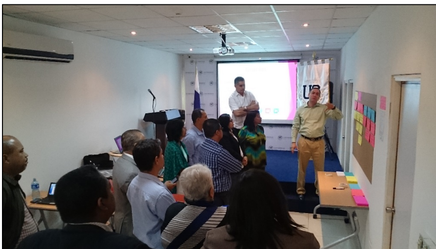
Jornada de planificación de investigación (diciembre, 2015).

Actividades y capacitaciones organizadas: Jornada de planificación de investigación en la UC (diciembre, 2015); Capacitación docente de actualización en herramientas de investigación (febrero, 2016); Seminario sobre el uso de recursos bibliográficos y bases de datos de EBSCO (junio, 2016); Taller de redacción de propuestas de investigación y desarrollo (julio, 2016).